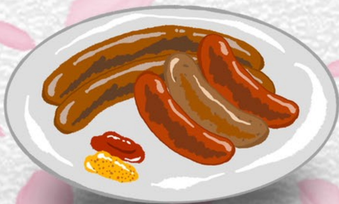
[4]ソーセージセレクト ¥600