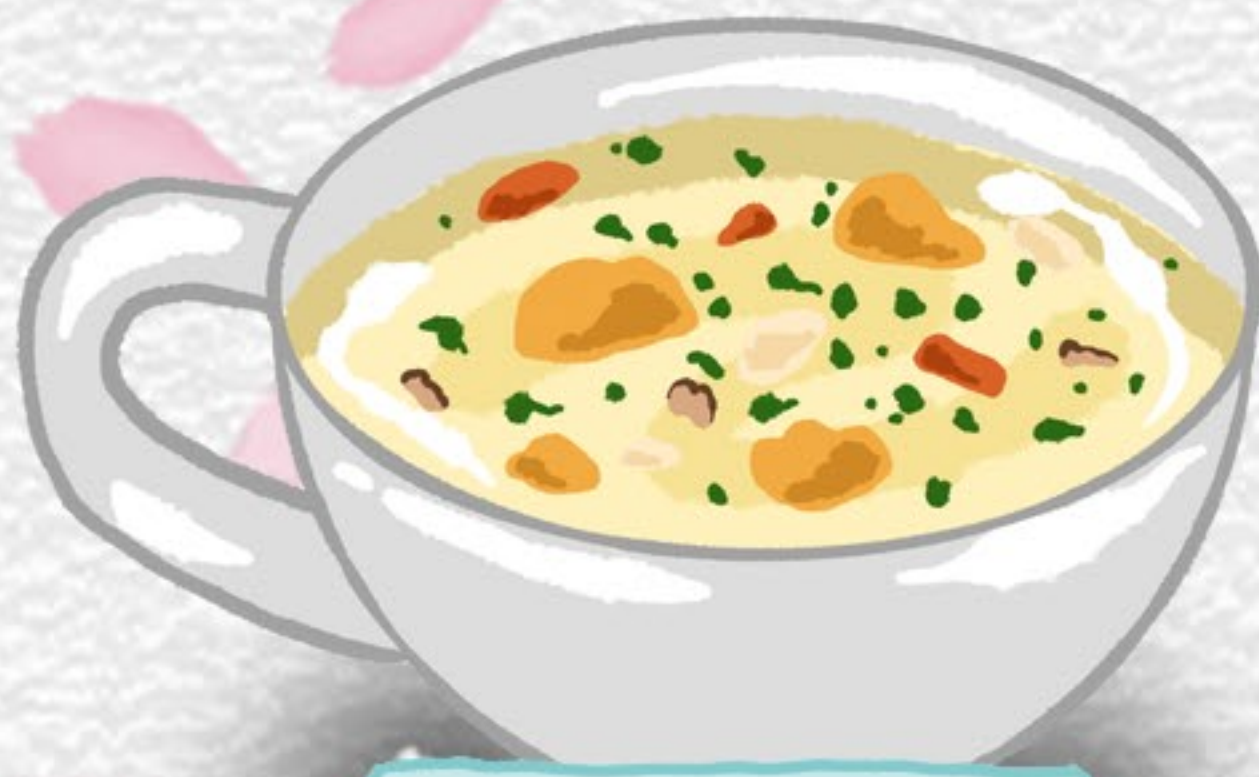
クラムチャウダー