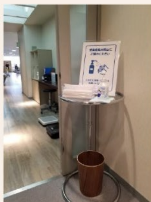
各エリア入口に 消毒液を設置