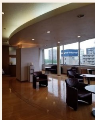
椅子・テーブルは 対面を避けるよう配置