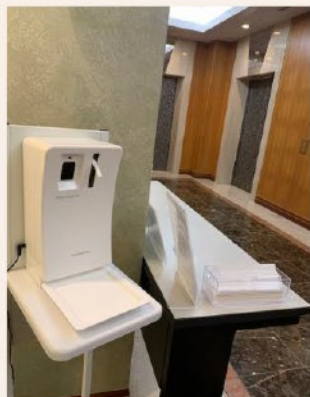
店舗入口に 消毒液を設置