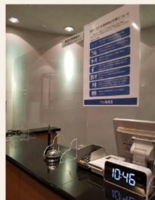
接触を避けるため 飛沫防止ボードを設置