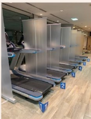
マシン飛沫防止ボード を設置