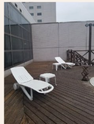
屋外ジャグジー チェアの間隔を確保