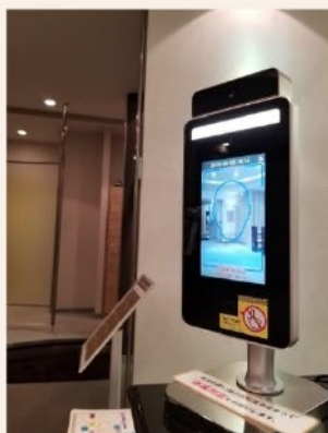
ご入館者様へ 検温を実施