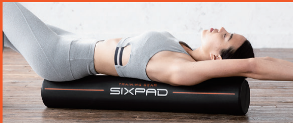
肩甲骨まわりをストレッチ。筋肉を緩めて本来あるべき状態へ。 Body Pole 単品2,900円 ボディポール