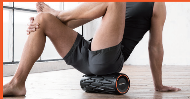
パワフルな振動機能搭載。本格的なセルフストレッチを実現。 Power Roller 単品13,800円 パワーローラー