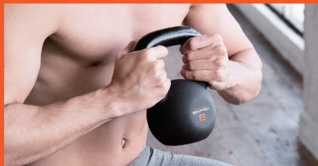
全身の筋力・持久力を養い、体幹やインナーマッスルを鍛える。 Kettle Bell 単品1,880円 ケトルベル 4kg