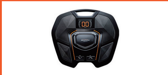
足を乗せることで、歩く為に必要な筋肉が鍛えられる。 Foot Fit 単品36,800円 フットフィット