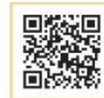
メール配信サービスQRコード

また、感染拡大防止のため泳法テスト終了後の幼児クラス保護者様との面談実施はいたしませんことをご承いただけますようお願い申し上げます。