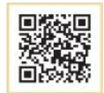
メール配信サービスQRコード