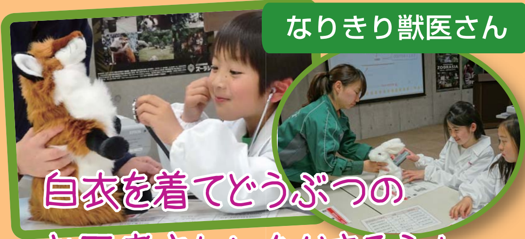
なりきり獣医さん

●催行決定日: 6月1日(金) ●募集締切日: 6月1日(金) または定員になり次第