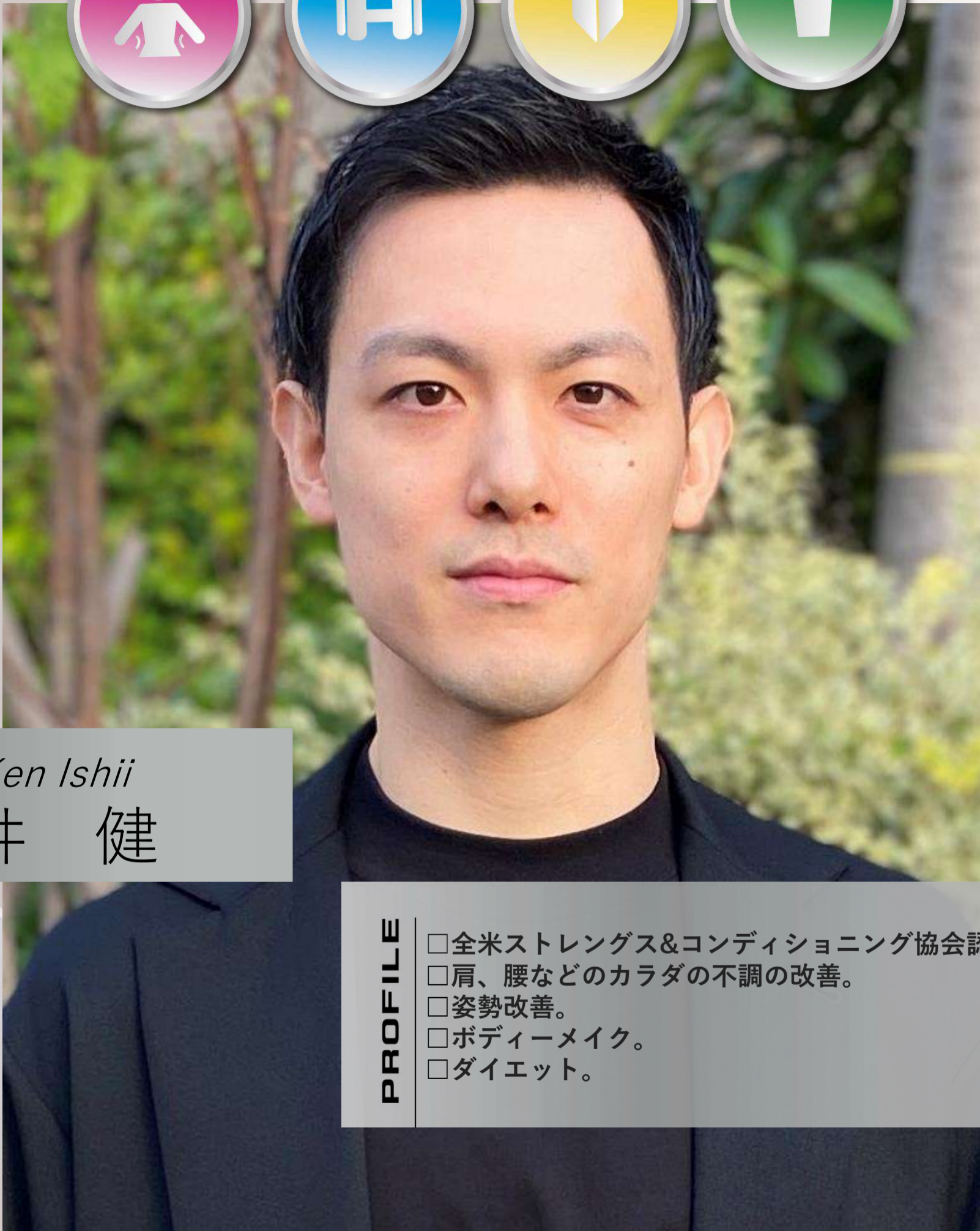
Ken Ishii 石井 健