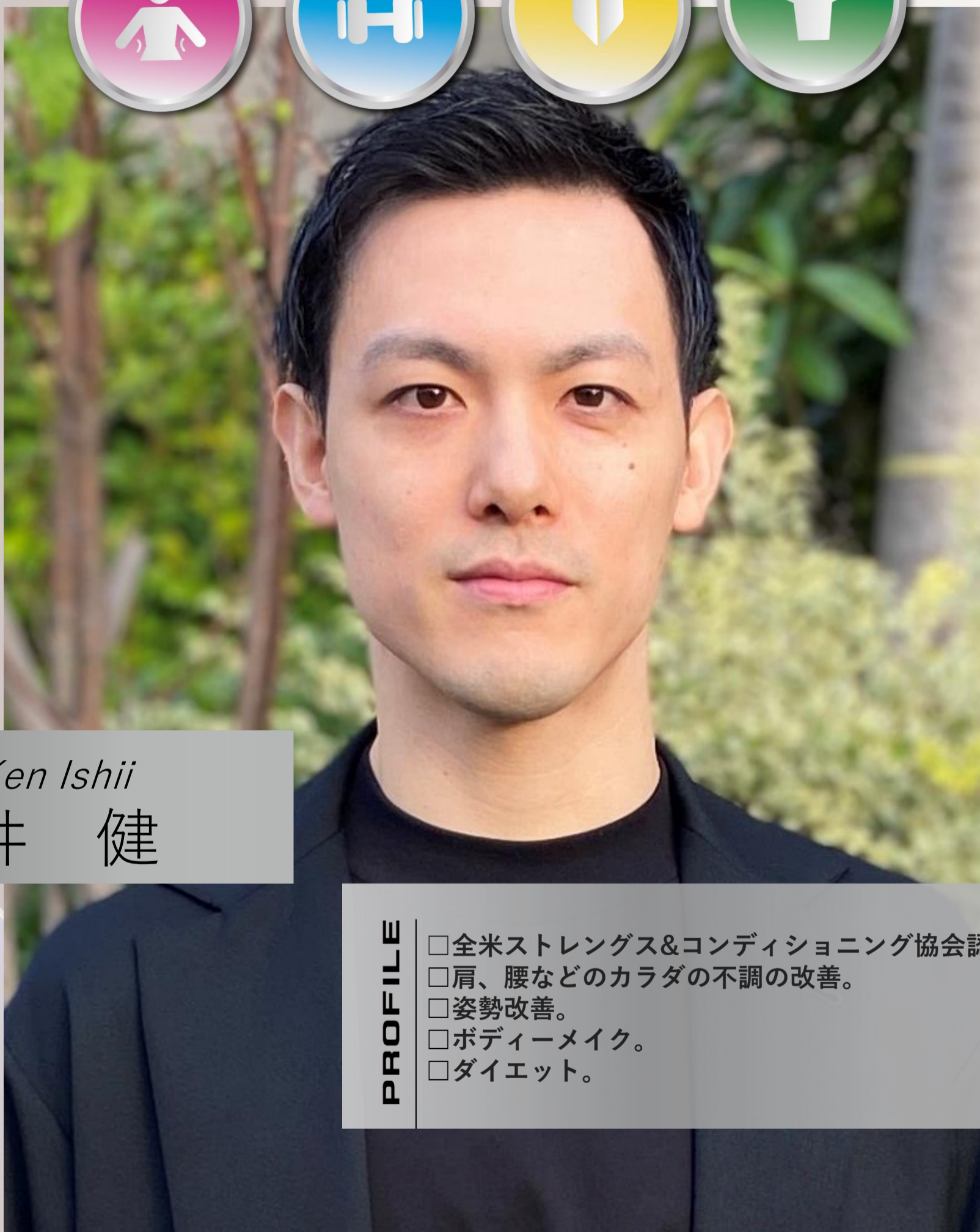
Ken Ishii 石井 健